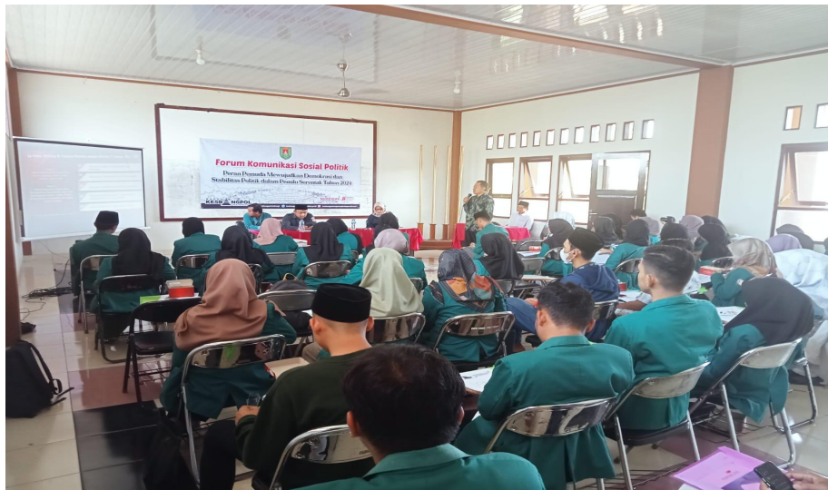
Foto sosialisasi menjadi narasumber bersama mahasiswa STAIA Syubbanul Wathon