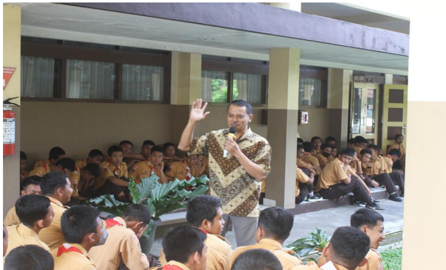
Foto sosialisasi pendidikan pemilu di SMK Pangudi Luhur Muntilan