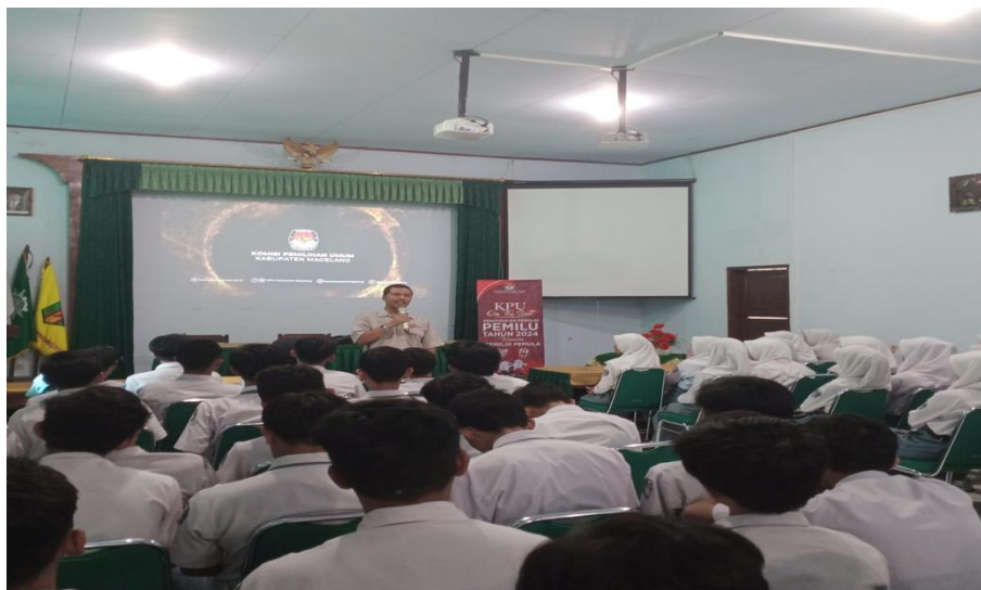
Foto sosialisasi pendidikan pemilu di SMK 1 Muhammadiyah Salaman