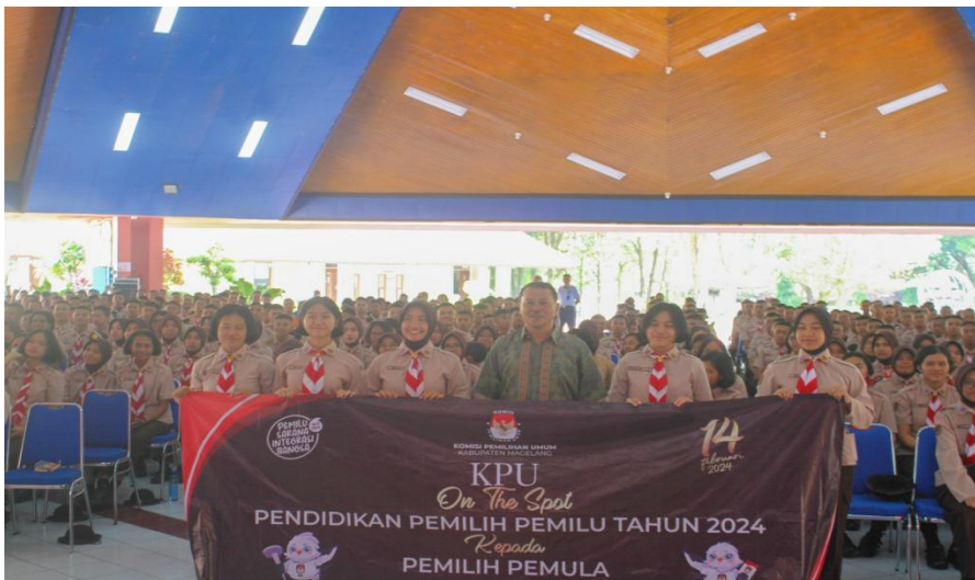
Foto sosialisasi pendidikan Pemilu di SMA Taruna Nusantara