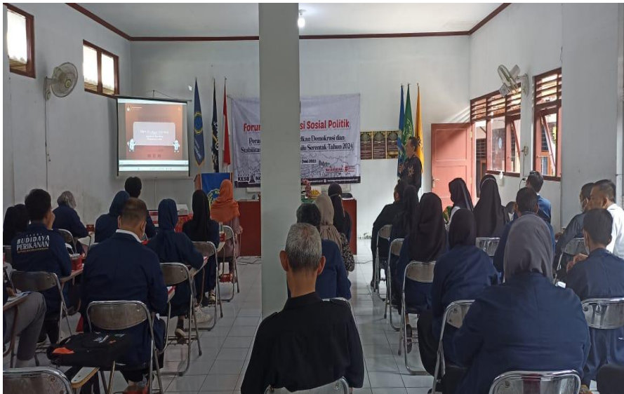
Foto sosialisasi menjadi narasumber bersama mahasiswa Politeknik Muhammadiyah Magelang