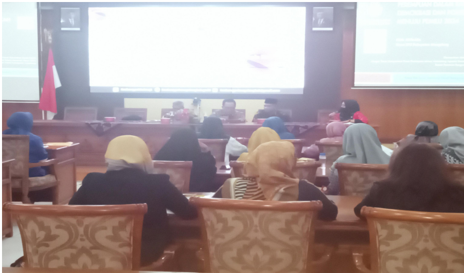
Foto sosialisasi menjadi narasumber bersama kaum perempuan