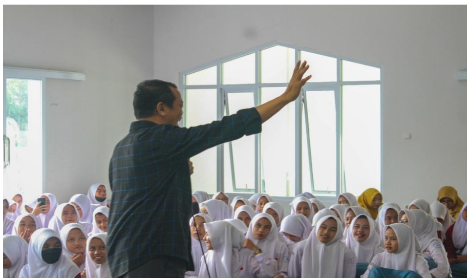
Foto sosialisasi pendidikan Pemilu di SMK N 1 Ngablak